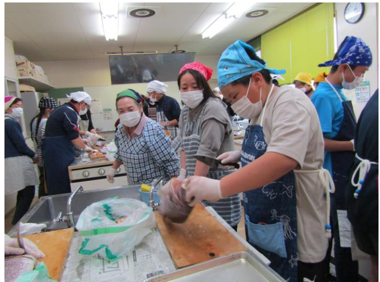
【親子料理教室 福浦公民館】

日時 令和5年5月25日(木) 午後3時から 場所 西海町民会館 3階 大ホール