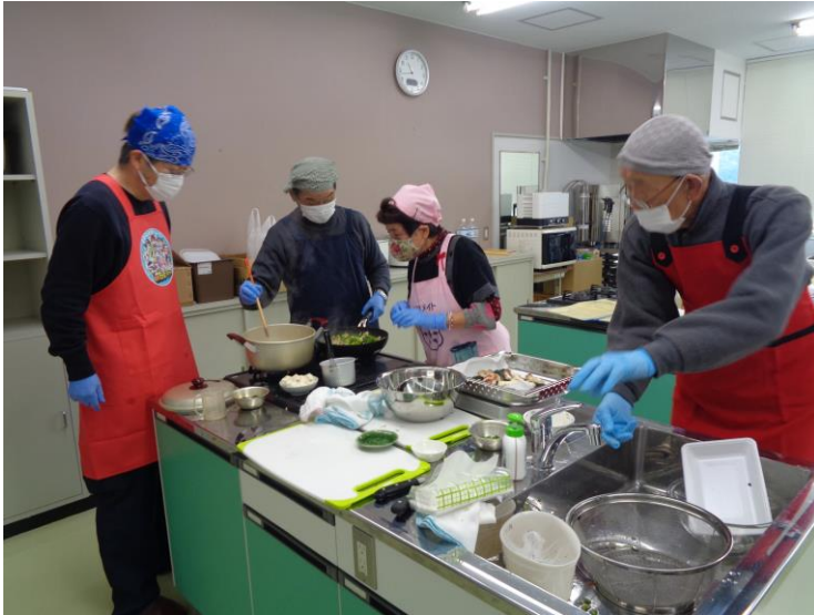
【男の料理教室 西浦公民館】