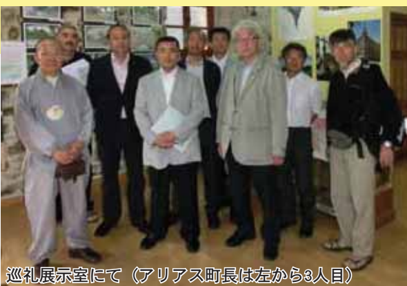
巡礼展示室にて（アリアス町長は左から3人目）

次に、モリナセカ町庁舎から歩いて数分の所にある巡礼関係の展示室に向かいました。展示室では、日本の巡礼関係の物が数多く展示されています。このような他国の巡礼関係の物を集めた展示室は珍しく問合せもよくあるそうです。実際、