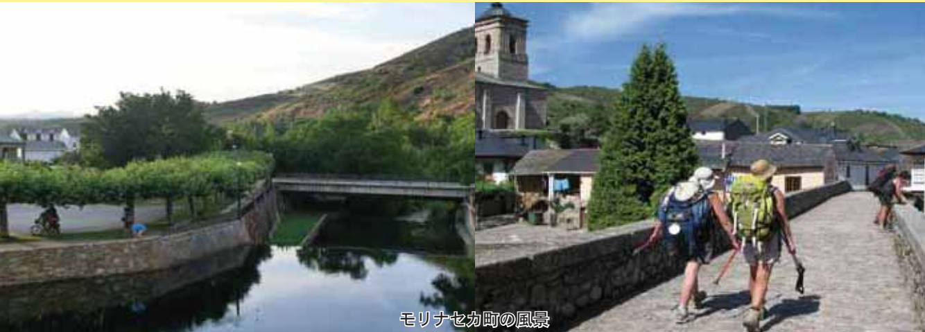
モリナセカ町の風景

私は、まずモリナセカ町役場を訪問し、アリアス町長と久しぶりの再会を果たすとともに、町長室でお互いの町のことや今後の交流のあり方について意見交換を行いました。会談ではアリアス町長から、①文化・経済等