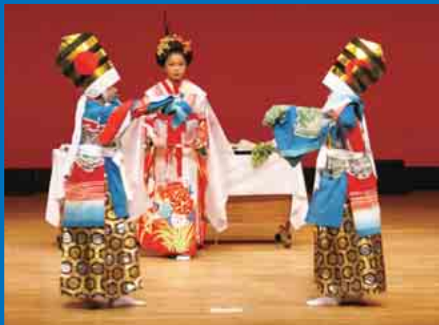
御荘文化センターで行われた「愛南町文化祭」で、オープニングを務めた町指定無形民俗文化財の「福浦寿三番叟」です。(11/21) 【P19参照】