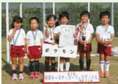
優勝 ポケモン（城辺幼稚園）