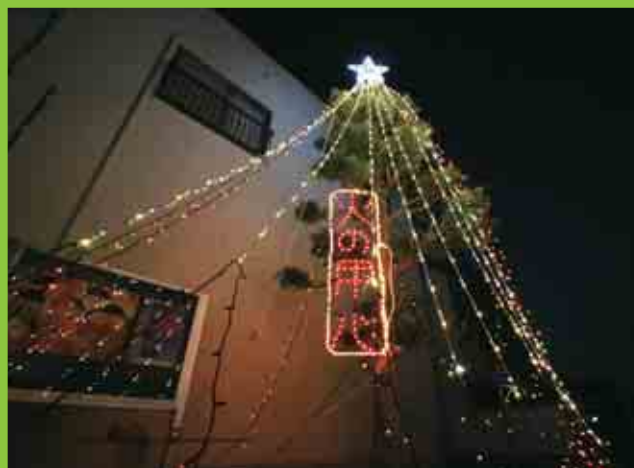
愛南町消防団御荘方面隊第1分団平城支部の詰所に、「火の用心」イルミネーションが登場しました。(12/2)

表紙の写真コメント 初冬の篠山では、モミジが鮮やかに紅葉しています。写真は大規模林道「篠山トンネル」手前にある「白滝園地」のモミジです。