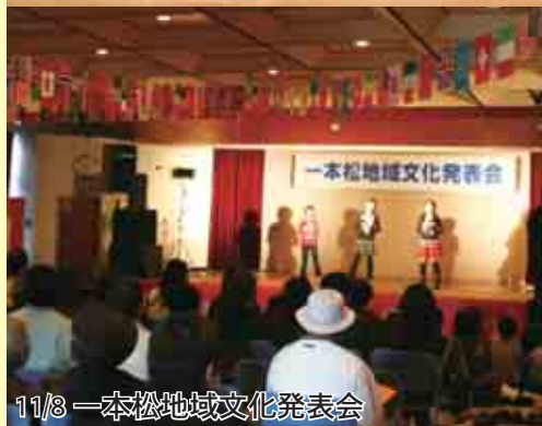
11/8 一本松地域文化発表会