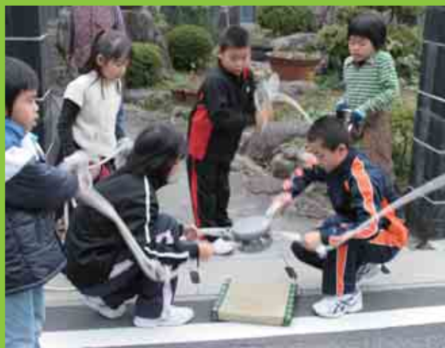
柏地区の「亥の子」の様子です。亥の子唄を歌いながら、家々の玄関先で石をついて回ります。(11/29)