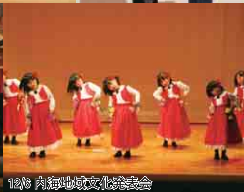
12/6 内海地域文化発表会