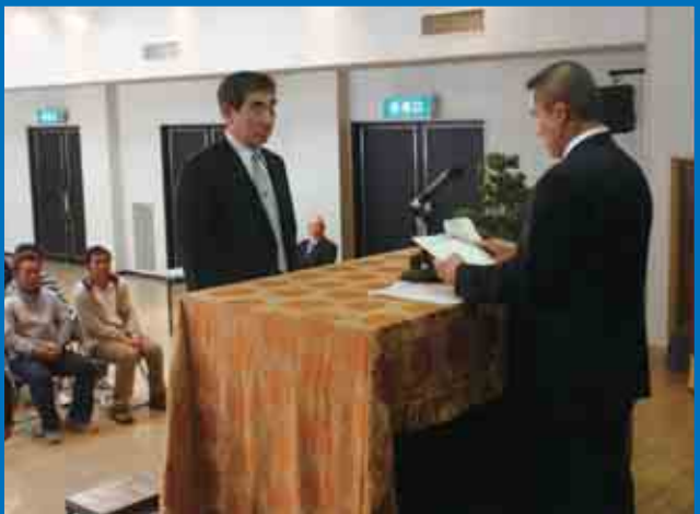
初めて西海町民会館で行われた「船舶職員養成講習会」で講習を修了した31人に清水町長から修業証書が手渡されました。(11/30) 【P9参照】