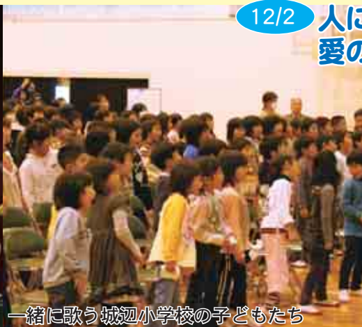
一緒に歌う城辺小学校の子どもたち

城辺小学校体育館で、「クレア & 香 愛の風コンサート」が開催され、全校児童や保護者など約230名が、本物の芸術を楽しみました。