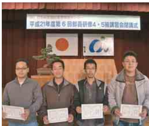
町内から受講した皆さん

西海町民会館において船舶職員養成講習会（4・5級海技士研修）の閉講式が行われ、講習を修了した31名（航海科22名、機関科9名）に、清水町長から修業証書が手