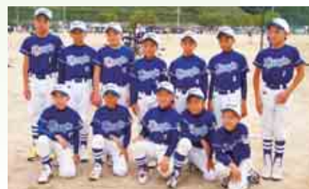
平城スポーツ少年団 ソフトボール部