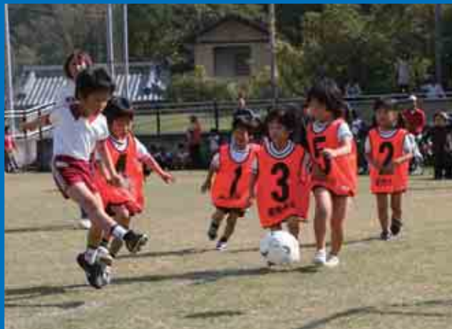
南レク城辺芝球技場で行われた「第3回愛南キッズサッカーフェスティバル」で、楽しそうにボールを追いかける子どもたちです。(11/8) 【P20参照】