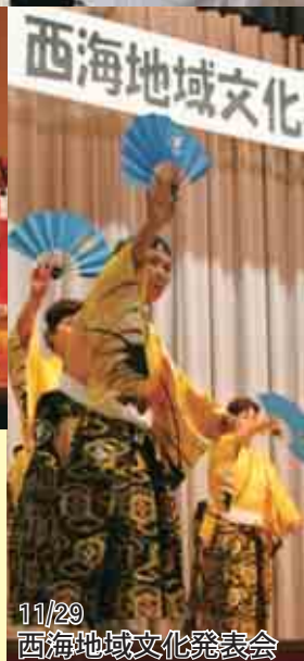
11/29 西海地域文化発表会