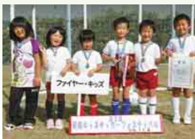
準優勝 ファイヤー・キッズ（緑保育所）