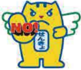
贈らない・求めない・受け取らない