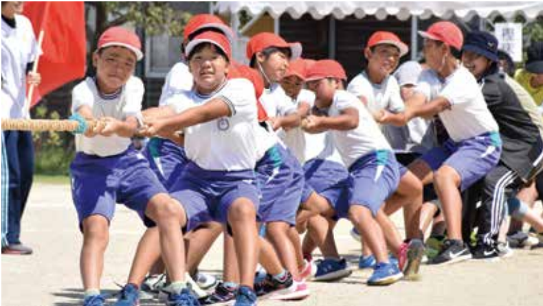
綱引きには小学生や地域住民らが参加