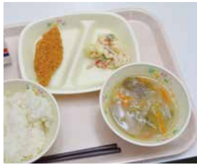
ロシアのシチーやオリビエサラダが献立に取り入れられました