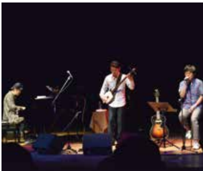
津軽三味線の音色や歌声が会場を包みました

公演当日は、伝統楽器三味線の美しい音色と現代のポップスが融合する見応え満載のステージで、澄み渡るような津軽三味線の音色や歌声の響きに満員となった会場は感動に包まれました。