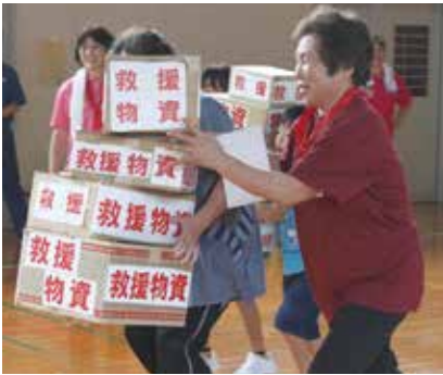
救援物資に見立てた箱を協力して運ぶ参加者

非常用持ち出し品を正しく袋に詰める競技など、防災をテーマにした種目を行い、楽しみながら防災知識を学びました。