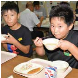
給食でロシアの料理を味わう福浦小児童