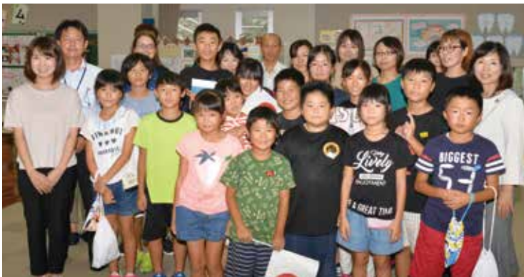
親子給食を楽しんだ福浦小の児童や保護者、教職員の皆さん