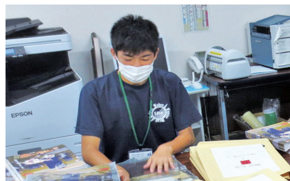
▲一生懸命作業する生徒

少しでも役に立てるようにと、一生懸命仕事をしてきた生徒に大変だった仕事について聞くと、「選挙準備の業務が大変だった。広報仕分けは、特によかったです」と感想を述べていました。