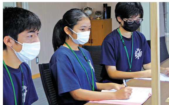
▲真剣に町長へインタビューをする生徒たち

インタビューを終えた生徒は、「これから親孝行をたくさんしたい。努力をして目標を達成したい」と話しました。