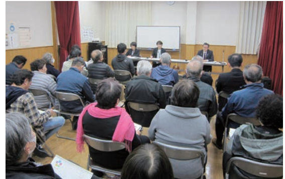
▲菊川公民館の様子