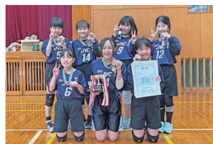
▲2部優勝: 南宇和ジュニアバレーボールクラブB