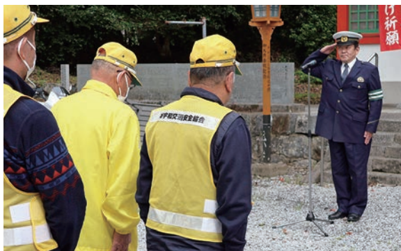
▲八幡神社で行われた交通安全祈願祭の様子

4月6日(月)、八幡神社で交通安全運動出陣式・交通安全祈願祭が行われました。南宇和交通安全協会、愛南町交通安全推進協議会、愛南安全運転管理者等協議会、愛南警察署の4団体の主催により行われた祈願祭では、宮司のお祓いや祝詞奏上、玉串を祭壇に捧げる神事が行われた後、交通安全活動を実施している各団体の代表者に交通安全を祈願するお守りが手渡されました。