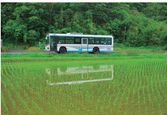
▲昨年度入賞作品(作品名:水田をゆく)