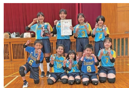
▲1部優勝: 一本松バレーボールクラブ