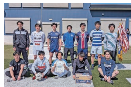
▲1部優勝: SIMA's FC