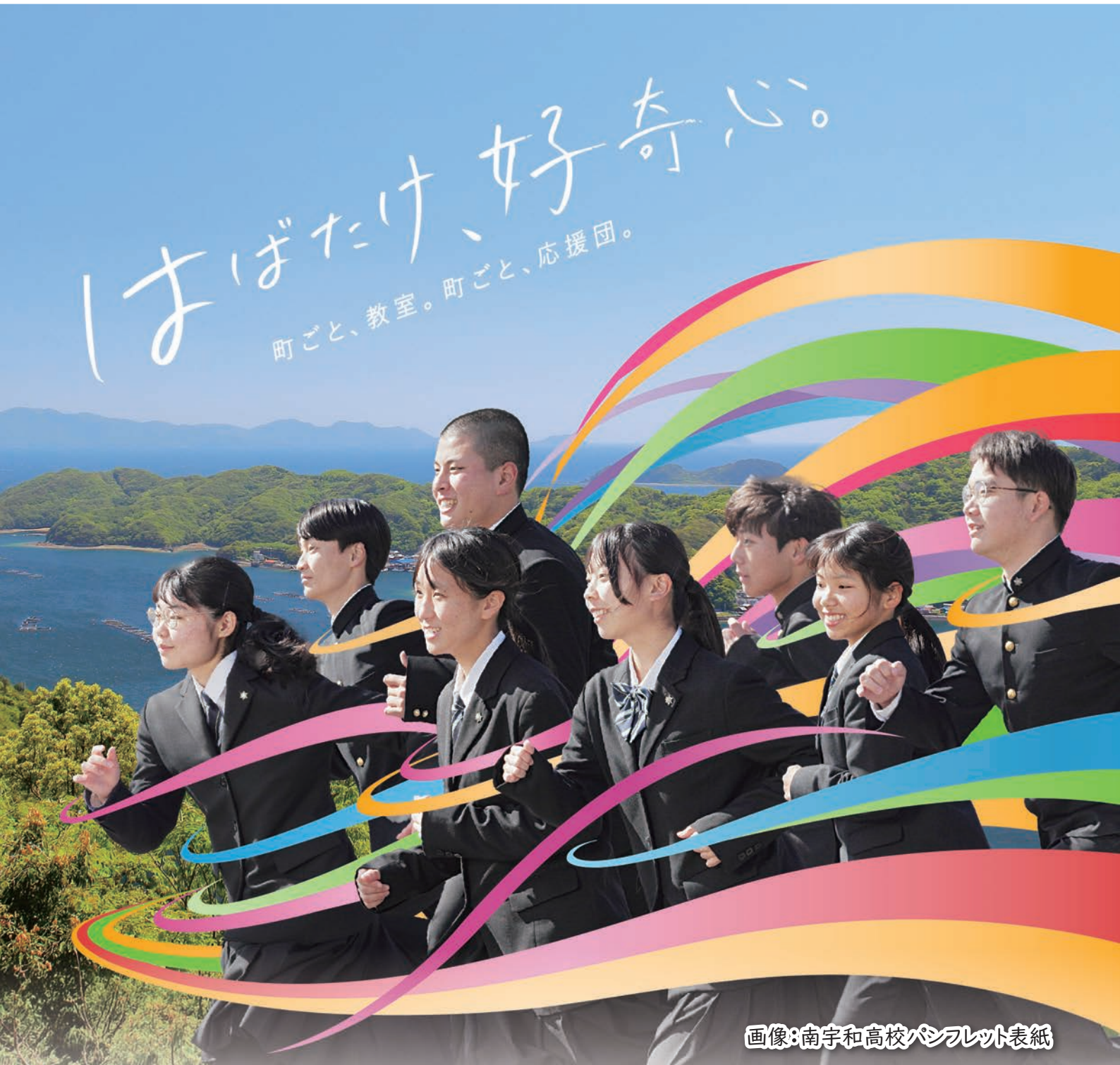
画像:南宇和高校パンフレット表紙