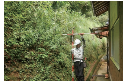
▲住宅裏の急傾斜地地形等を確認します