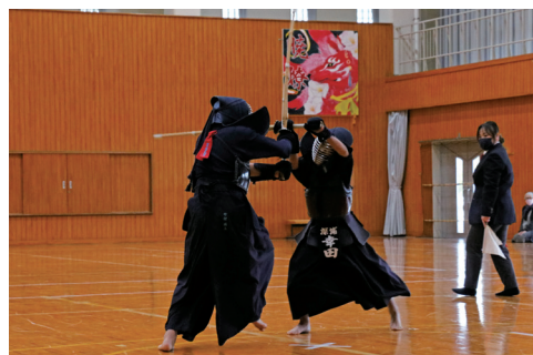
▲一進一退の攻防を繰り広げる剣士