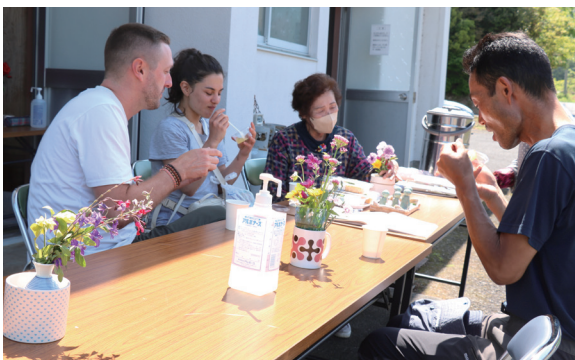
▲小山本村集会所でおもてなしを受けるお遍路さん

ゴールデンウィーク中の2日間、町連合婦人会一本松支部がお遍路さんへのお接待を実施しました。小山本村集会所と国道56号線沿いの2カ所で、春の食材を使ったお弁当や河内晩柑のゼリーなどが振る舞われました。