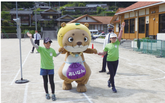
▲なーし君と一緒に横断歩道の渡り方を再確認する児童生徒たち

高知県との県境に位置する篠山小中学校で、交通事故を防止するための交通安全教室を開催しました。この教室は、愛南警察署、宿毛警察署、南宇和交通安全協会などが合同で毎年開催しているもので、両市町のマスコットキャラクターと一緒に楽しく交通ルールについて学びました。