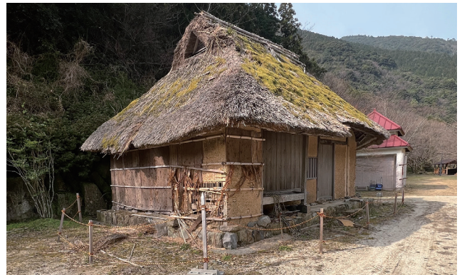
▲老朽化が著しい現在の様子

移設から現在に至るまでの建物の管理は、地元保存団体を経て町が維持管理を行ってきましたが、近年は屋根の風損に加え、雨漏りの深刻化など、今後の維持管理が困難な状況となっていました。