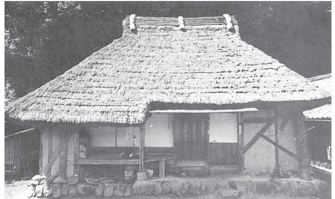
▲指定前のチョウナづくりの家(昭和30年代)

その後、平成16年2月に、当初の所在地の僧都から現在の山出に移設されましたが、この際に元々の建材の半数以上が新しい材に入れ替わって復元されています。