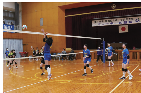
▲チーム一丸となりフレッシュなプレーを見せる選手たち