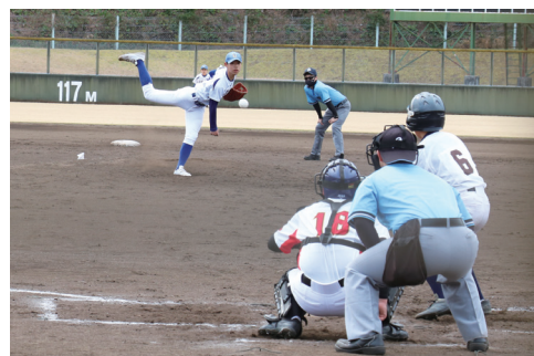
▲相手打線に立ち向かい全力投球

愛南町からは、3つの中学校（内海・御荘・城辺）で構成する合同チームが出場しました。1日目に保内中学校を破った選手たちは、勢いそのままに2日目の城東中学校にも勝利して見事予選通過を果たしました。選手たちの気迫のあふれるプレーに、仲間や観客から熱い声援が送られました。