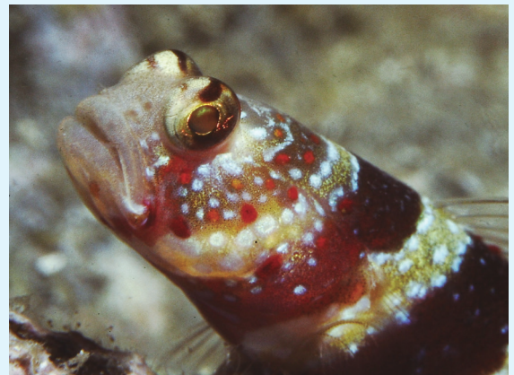
【見張りをするクビアカハゼ】

クビアカハゼは、名前の通り、首に赤色の帯がある。その周りに赤色・黄色・白色の派手な水玉模様が付いている。体長が6cmほどの小さなハゼの仲間で、テッポウエビの掘った巣穴に居候している。住まわせてもらう代わりに、エビが魚に襲われないように見張りをしている。穴を掘るのが得意なテッポウエビと、視力の良いハゼと