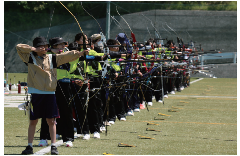
▲青空の下、集中して矢を放つ参加者たち