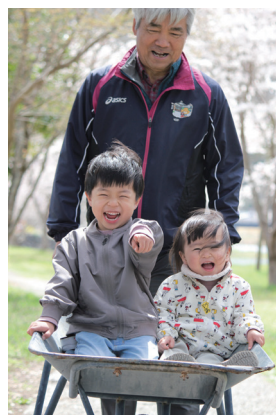
小・中・高校生の部知事賞▶ 「団子親子」