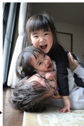
◀一般の部知事賞 「また乗せてね♪」