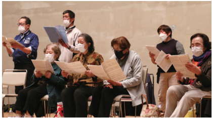
◀合唱団コスモスの練習に励む2人