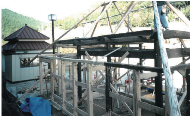
▲指定有形民俗文化財「チョウナづくりの家」 移設復元作業(白い材は全て新しい材)