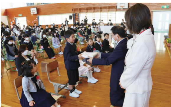
▲元気な声でお礼を言い教科書を受け取る新入生

4月10日(月)に町内9つの小学校で、4月11日(火)は町内5つの中学校で入学式が行われました。小学校では74人、中学校では115人の児童生徒が、新たな学校生活をスタートしました。