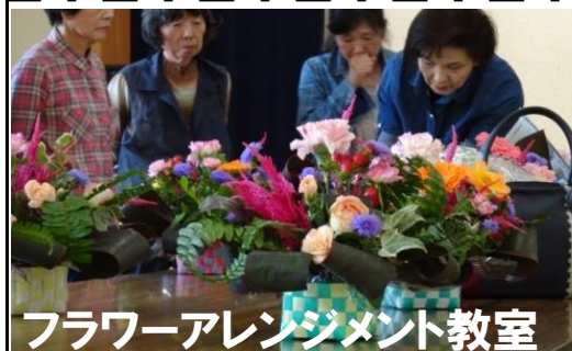
フラワーアレンジメント教室

バラ園づくりを主としている婦人学級ですが、いろいろな活動を試みようということで、11月30日(土)には慣れ親しんだ花を使ってのフラワーアレンジメント教室を、12月3日(火)にはバラ園の周りの環境整備をということで花壇作りを、12月11日(水)にはモノ作りに挑戦で、リース作りを実施しました。これからいろいろなことに取り組んでいきますので、興味のある方は、東海公民館までお問い合わせください。