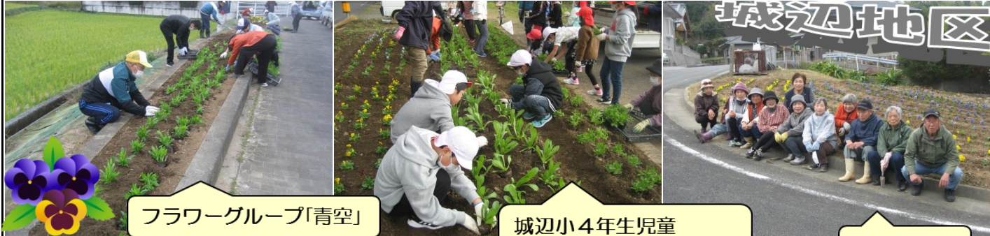
フラワーグループ「青空」 城辺小4年生児童フラワーグループ「青空」 鳥越サロン