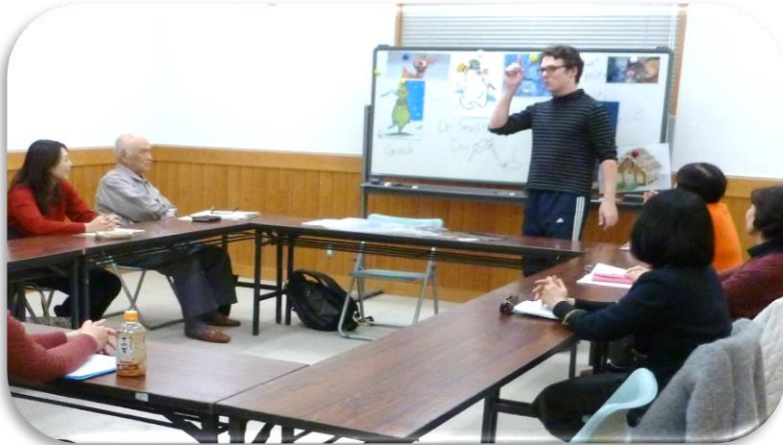
英会話教室のエイジエー講師と受講生(昨年度撮影)

ハーモニカ教室は、事業の開始が少し遅れますが、他の教室は、手洗い・マスク着用などの感染防止対策を講じたうえで開始します。皆様のご参加をお待ちしています。なお、今後の感染状況等により、事業の中止や延期をする場合があります。ご理解とご協力をお願いします。