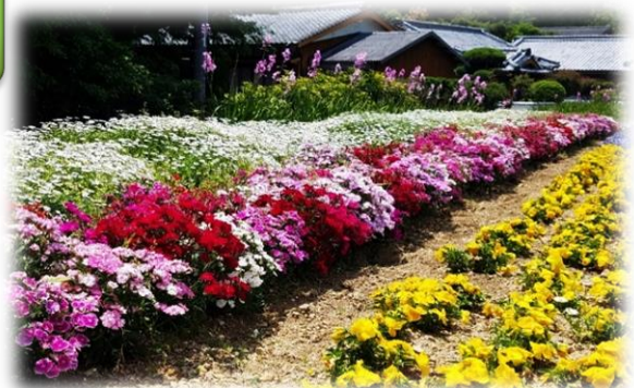
深泥青年部が育てた花壇 R2年5月5日撮影

公民館アンケートにご協力いただき、ありがとうございました。3つの満足度は、前年度より少し下がりましたが、90%以上の高い評価を得て、大変うれしく思います。皆様のご意見は、実現できることから改善していきます。今年度も、皆様に満足していただけるよう頑張ります(*^^)v