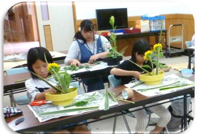
こども生花教室の清家講師と児童(昨年度撮影)