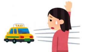
医療従事者の入店やタクシー乗車を拒否