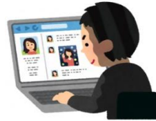
感染した人の住所や勤務先の詮索、拡散