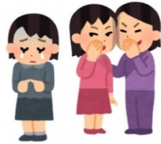
感染した人及びその家族に対するいじめ

「家族を感染から守りたい」という気持ちは誰もが持っているものです。そのような動機は間違っていないかったとしても、会話の中のひとことが重要な仕事をしている人々への攻撃になってしまうことがあります。苦しむ必要のない人を傷つける言動はやめて、互いに思いやりを持ち、正しい理解に基づいて行動することを、今、改めて考える時ではないでしょうか。（法務省ホームページより抜粋）