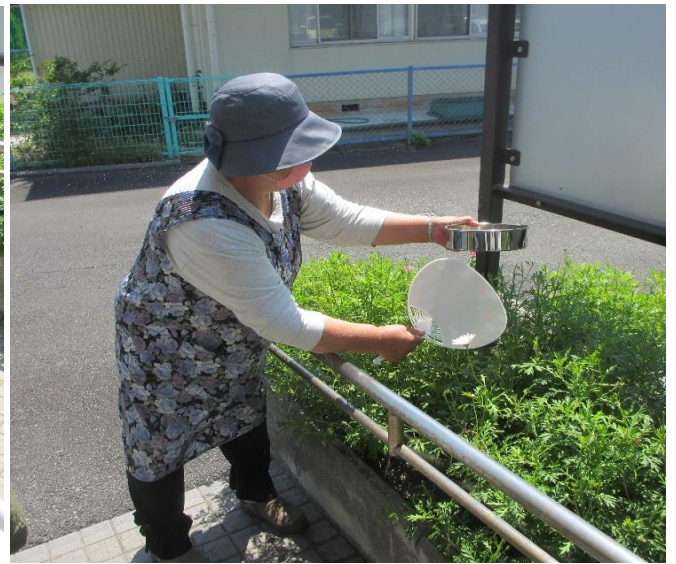
目の細かいザルに移し、風を送っています。