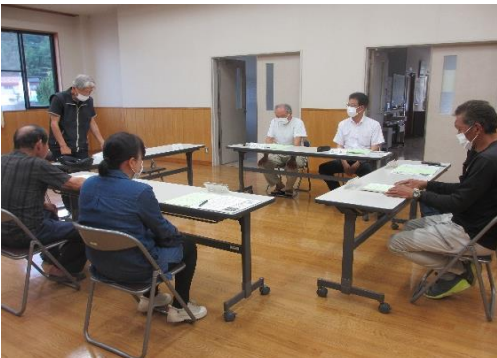
ご意見ありがとうございました。

今年度から運営審議会は年3回の開催となります。第2回目は委員の皆様のご意見を予算編成に反映させるため、11月頃に開催します。各事業ごとに課題・問題点・必要性等を審議していただき、来年度の公民館運営を活性化したいと思います。