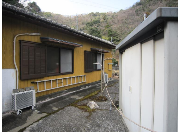
外観 (裏手)・ストックハウス